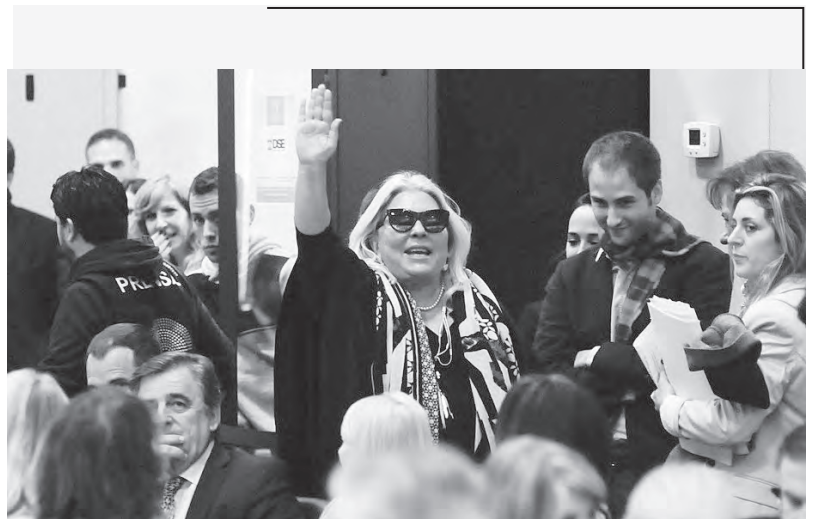
Carrió se retira en medio de la polémica con diputados del FIT

Seamos claros: estamos a favor de tener energía. Pero al servicio de un proyecto de desarrollo para los trabajadores, sectores populares y la producción nacional. Y para esto hay que independizarse de las multinacionales, los banqueros y el gran capital. Para que la energía no sea un gran negocio sólo de Repsol, Chevron, Barrick Gold y las multinacionales. Se trata de un recurso estratégico que no puede estar en manos privadas. Es el Estado quien debe desarrollar el sistema energético, bajo control de los trabajadores, técnicos, científicos, asociaciones ambientalistas, poblaciones y pueblos originarios involucrados y de los propios usuarios.