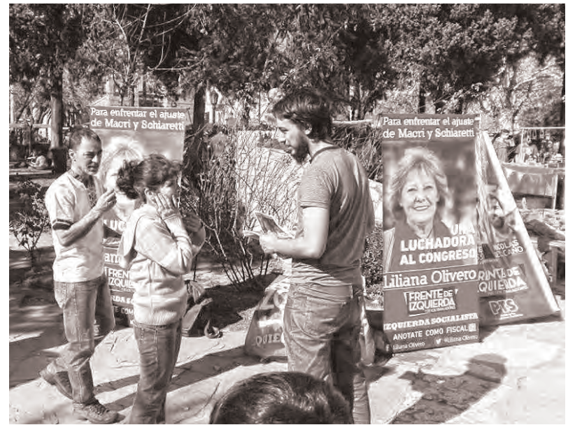
Izquierda Socialista haciendo campaña en las calles cordobesas

Algo totalmente distinto es lo que sucede con mi candidatura y las del Frente de Izquierda. Lejos de los millones de pesos gastados por los otros candidatos, nuestra campaña es a pulmón, con la fuerza de la militancia en la calle, charlando con trabajadores, mujeres, jóvenes y vecinos, contando nuestras propuestas, explicando la necesidad de un cambio profundo, con propuestas de fondo para los problemas de la economía, el ambiente, de la falta de oportunidad en la juventud o contra la violencia hacia las mujeres. Pero no solo lo refleja la calle, donde en cada actividad se acercan decenas de vecinos a plantear que quieren ayudar en la campaña, sino que los principales medios de la provincia tienen que reconocerlo, mostrando que la pelea por la novena banca