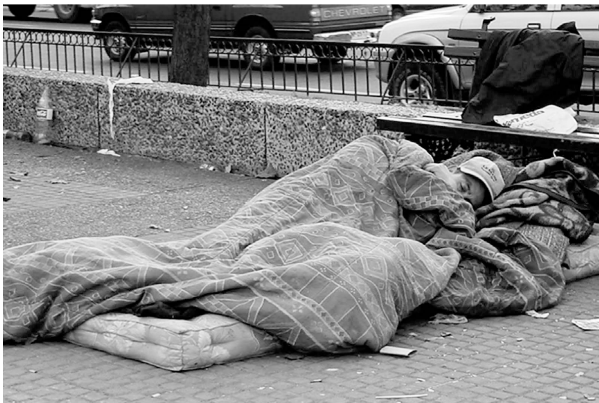
Drástico aumento de personas en situación de calle

mado un proyecto de asociaciones como Inquilinos Agrupados que piden reclamos mínimos, como que estos no deban hacerse cargo de las comisiones que cobran las inmobiliarias y que los gastos de pedidos de informes sean gratuitos. Estos justos reclamos, sin embargo, no alcanzan.