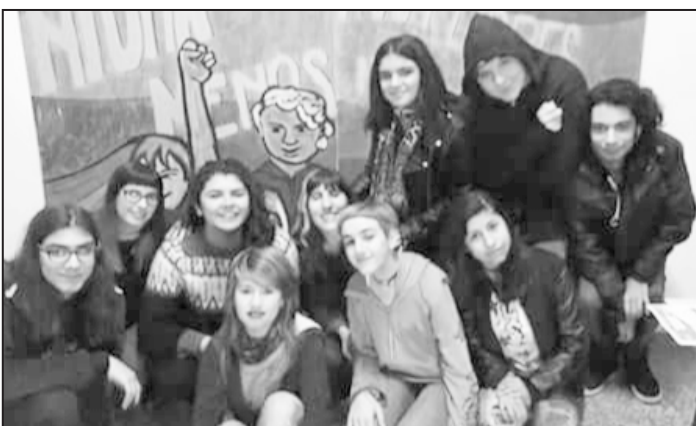
Estudiantes secundarios de La Matanza (entre ellos el presidente y el secretario general del Centro de Estudiantes de la EES N° 141 y activistas de la Media 20 que están peleando contra las autoridades para conformar su centro) llaman a votar y hacen campaña por el Frente de Izquierda.

Que la plata vaya para educación y trabajo para que los pibes puedan educarse y conseguir un trabajo digno, no para la deuda.