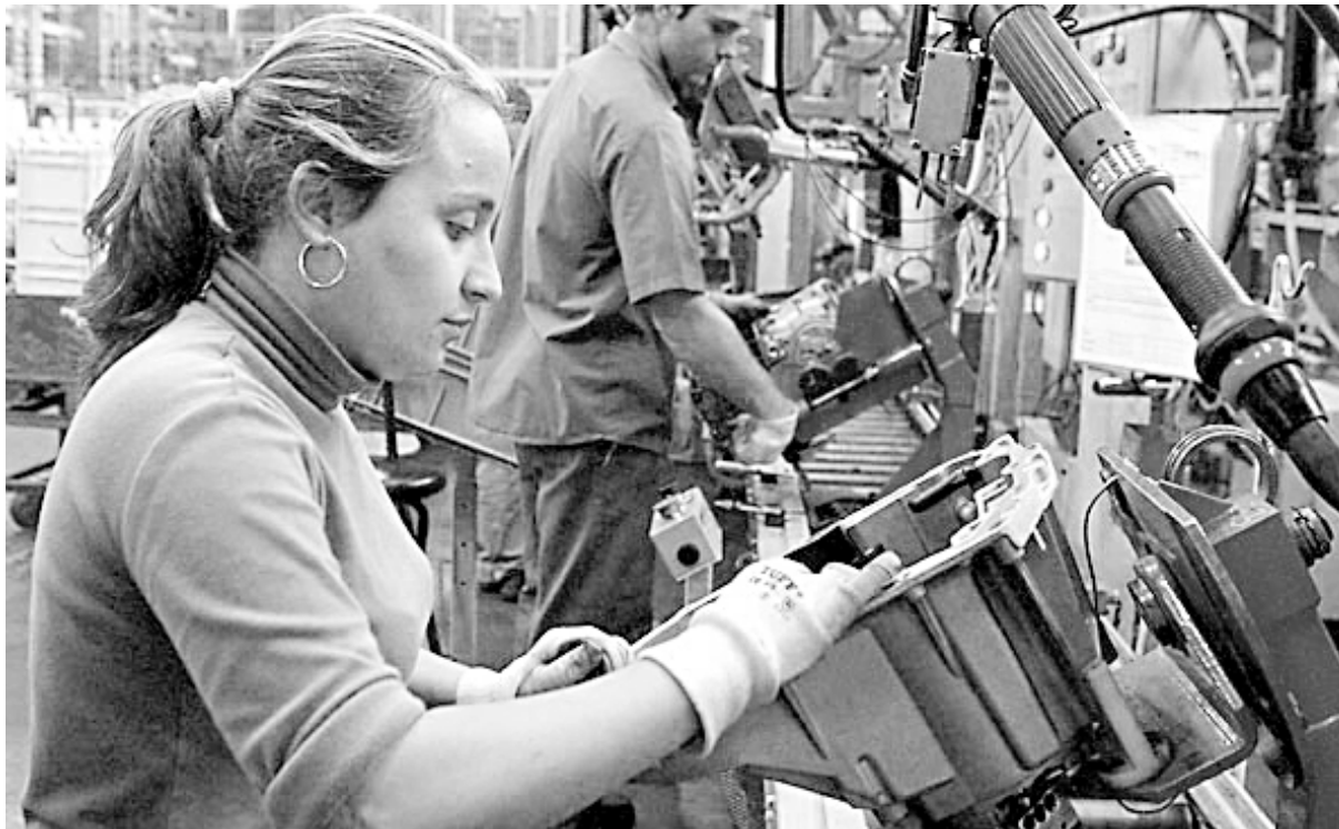
Los jóvenes tienen los trabajos más flexibilizados y peor pagos

A esa cuestión hay que sumarle otros problemas, como la falta de vacantes en las escuelas, que llega a 1.248.839 en todo el país, y la crisis de la educación en general por vía del desfinanciamiento continuo de todos los gobiernos. Por otro lado, el cierre de espacios públicos y la falta de políticas masivas de acceso