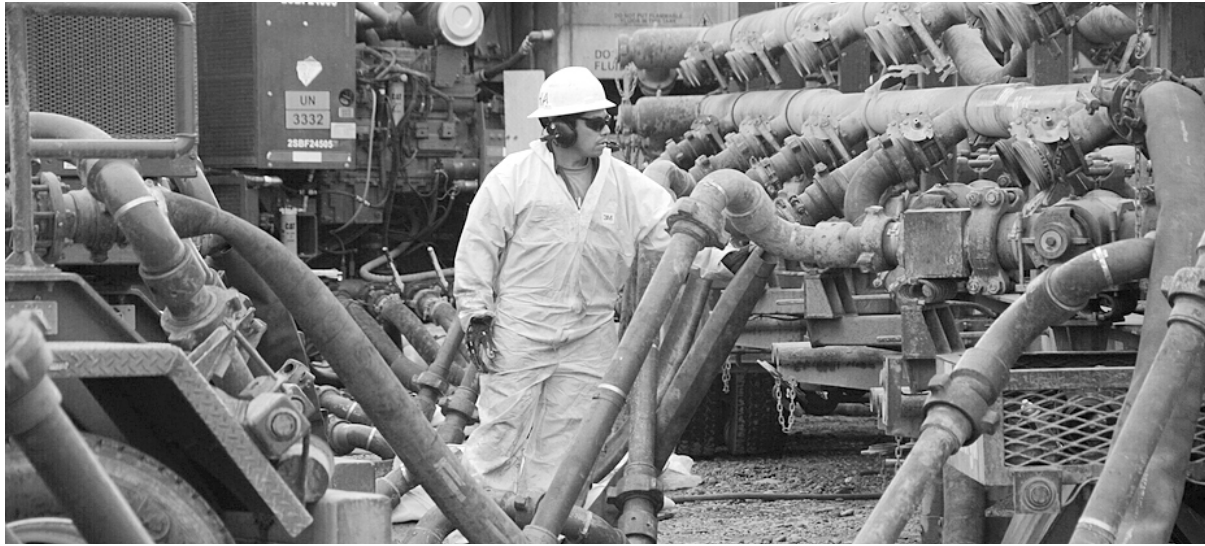
Trabajador en el yacimiento petrolero de Vaca Muerta, Neuquén

Hace más de un año que aparece este planteo. Varias veces lo enunció el propio presidente Macri, así como los jefes de las cámaras empresarias. Sostienen que para completar el ajuste hay que “flexibilizar el mercado de trabajo”. En las últimas semanas le agregan que, ahora que en Brasil se votó la nueva ley de reforma laboral, la economía argentina perderá competitividad si no hace algo parecido.