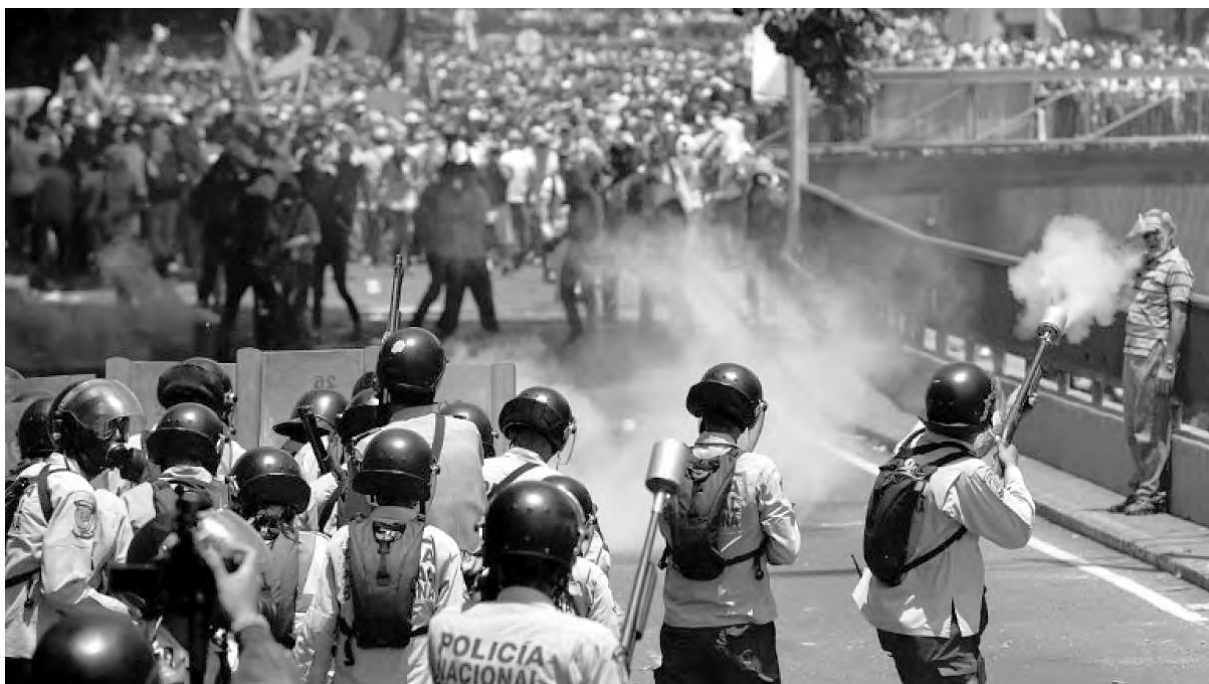
Sigue la represión de Maduro ante las protestas populares

Desde la izquierda hay sectores que no apoyan la rebelión y el reclamo de “fuera Maduro” con el argumento de que la MUD es la cabeza de la oposición. Que la MUD convoque marchas no niega esa rebelión popular. Por el contrario, las movilizaciones han desbordado a la MUD, que intenta controlarlas para que el gobierno no caiga por una acción revolucionaria, mientras busca usarlas para una negociación y que haya elecciones generales. Ese tipo de “Ni-Ni” favorece a Maduro. El Partido Socialismo y Libertad (PSL) participa de las movilizaciones populares desde una postura independiente de izquierda. Abstenerse y quedarse en su casa es dejar sin alternativa de izquierda a los miles y miles que se movilizan sin apoyar a la MUD.