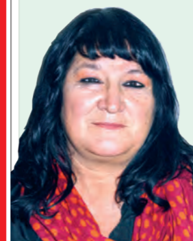
Escribe Gloria Cimino Candidata a diputada nacional

el ajuste de Macri demostró que hay un amplio sector de los trabajadores y la juventud que se identifican con las propuestas del Frente de Izquierda. "Nosotros vamos plantear los reclamos de los trabajadores y vamos a convocar al pueblo para movilizarse por estos reclamos. Es una legislatura de pactos capitalistas y vamos a plantear una salida obrera y socialista", declaró Díaz al conocerse el resultado de la elección.