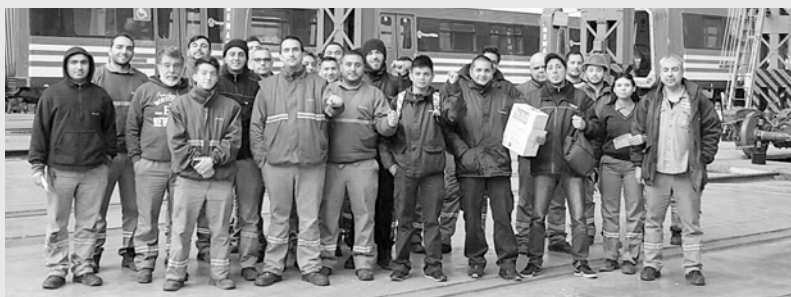
Trabajadores de PepsiCo recolectando para el fondo de lucha en el Sarmiento

Luego de la enorme marcha realizada la semana pasada, los trabajadores despedidos de PepsiCo instalaron una carpa frente al Congreso Nacional. La lucha de los compañeros tomó dimensión nacional luego de la brutal represión descargada contra quienes pedían por sus fuentes de trabajo. El repudio fue generalizado, incluyendo algunos editorialistas del oficialismo que atribuyeron a la represión ordenada por Macri como “un acto rayano con el barbarismo”. Las muestras de solidaridad en la carpa son incontables, gente que se acerca a colaborar con el fondo de lucha, estudiantes